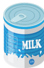
LEITE EM PÓ INTEGRAL 400G

As doações serão entregues ao INCAvoluntário que realiza projetos em prol dos pacientes em tratamento no Instituto Nacional de Câncer e que se encontram em vulnerabilidade social.